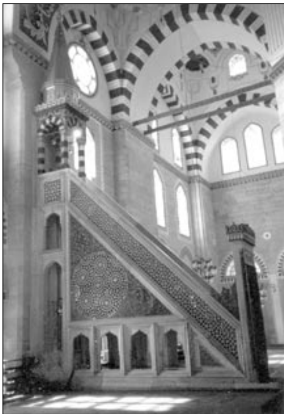
Vnitřek Princovy mešity Šehzády, kterou na paměť zemřelého Sulejmanova syna Mehmeda postavil jako své první dílo stavitel Sinan, bývalý velitel armádního ženijního sboru a budoucí největší architektonický talent Osmanské říše. Ač se o něm tvrdilo, že je líný, kromě Princovy mešity postavil největší mešitu Osmanské říše sultánu Sulejmanovi, dvě mešity jeho dceři Mihrimah, jednu jejím manželovi velkovezírovi Rüstemovi, provedl zpevňovací práce v Topkapu a Hagii Sofii, postavil prý nejkrásnější islámskou mešitu v Edirne a 348 dalších staveb.

Rozhodně stojí za návštěvu některá z mešit, kterých je zde velké množství (4000). Jsou dosti poskrovnu zařízené, stručně řečeno je tvoří červené koberce, lustry, korány a umyvadla na očistu. Do mešit se dostanete bez komplikací, modlíci se muslimové vás naprosto ignorují. Zato ale neignorují pípání mobilního telefonu, jak jsem se přesvědčil, když muslimovi uprostřed modlitby zazvonil mobil, který zvedl, a pak v klidu dokončil obřad.