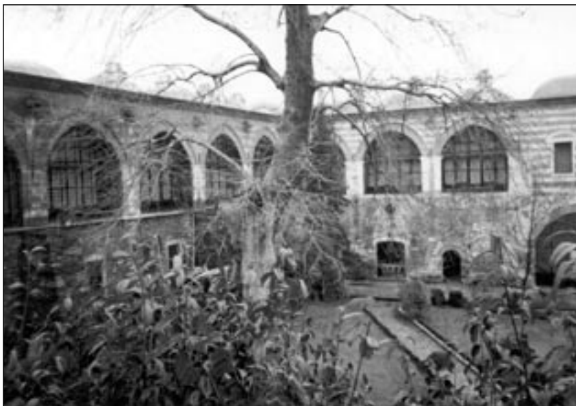
Palác Ibrahima Paši, velkovezíra a osobního přítele Sulejmana Nádherného, za jehož vlády dosáhla Osmanské říše vrcholu. Když velkovezír prohrál mocenský boj se sultánovou manželkou Roxolanou, byl na příkaz svého přítele uškrten palácovými eunuchy, jeho majetek zabaven a palác, velikostí soupeřící se sultánovým Topkapu, přestavěn v kasárna a vězení. Dnes muzeum Islámského umění.