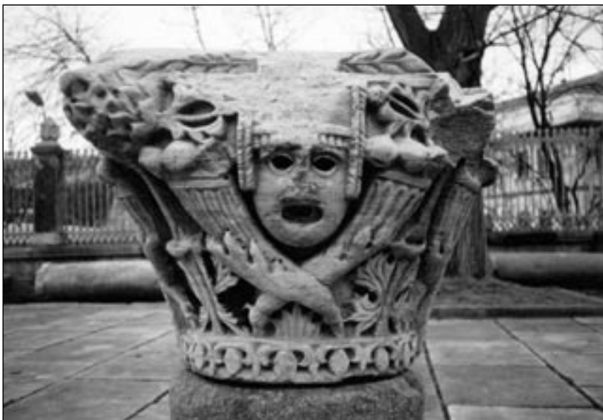
Hlavičky jednoho z přebytečných sloupů před Hagii Sofií. Pro stavbu chrámu se přivážel materiál z celé Byzantské říše, která v té době (6. století n. l.) dosáhla největšího územního rozsahu.