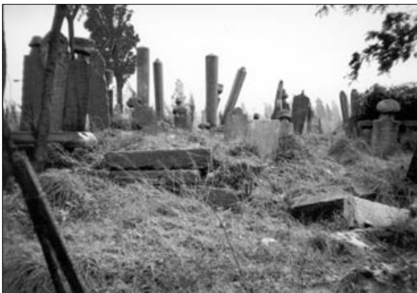
Starý hřbitov za cařihradskými městskými hradbami. Náhrobky, popsané arabským písmem, pocházejí z doby pozdní Osmanské říše – v dnešní Turecké republice se píše latinkou.

Když ho o více než tisíc let později, druhý den pádu Konstantinopole, definitivního zániku tisícileté Východořímské říše a více než dva tisíce let starého Římského impéria, následoval sultán Mehmed Dobyvatel, vzhlédl k drobcím se opěrným zdím, praskající klenbě a pomalu chátrajícím mozaikám a poprvé v životě si prý uvědomil, jak je život pomijivý a žádná stavba ani říše nemůže být věčná. Každý návštěvník pocítí oba názory současně. Hagia Sofia je neuvěřitelně velká a neuvěřitelně krásná, a je také velice zchátralá. Vstoupíte-li pomalu a tiše (jak jen to návaly turistů dovolí) po vzoru byzantských císařů a osmanských sultánů Císařskou branou (nikdo jiný takto dovnitř vstoupit nesměl), na cestu svítí barevné mozaiky z oken chrámu, reflektory osvětlují zbytky fresek na „nebeské“ klenbě, ohromí